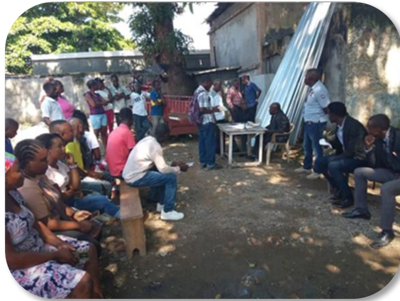
Tribunal de paix de Limbé, 15 octobre 2025

En octobre 2025, l'OCNH a mené une série de visites dans les tribunaux de paix des communes de Beaumont, du Limbé et d'autres zones afin de monitorer leur fonctionnement quotidien. Cette démarche visait à identifier les forces, les faiblesses et les besoins de ces juridictions de proximité.